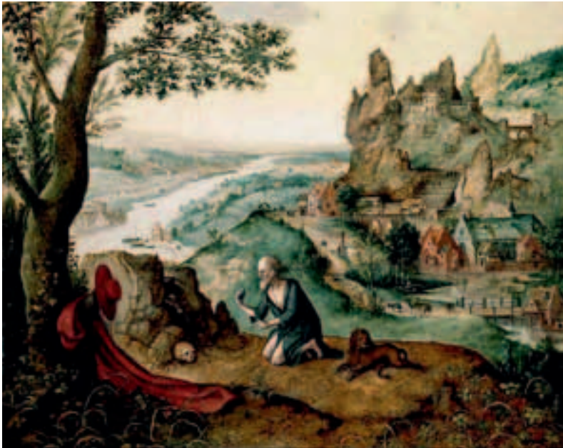
Landschap met de heilige Hieronymus, 1545-48, olieverf op doek.

tonen een bron met een manneke-pis figuur. De figuren op de versie van 1543 zijn vermoedelijk niet door Lucas Gassel maar door anderen geschilderd.