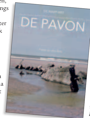
Boekomslag 'De ramp met de Pavon' van Pieter van den Berg

De soldaten waren vanaf nu krijgsgevangen en moesten achter de Duitse linies worden gebracht. Op zondagmorgen 26 mei werden de twaalfhonderd Nederlandse krijgsgevangenen in Montreuil vrijgelaten waarna grotere en kleine groepjes soldaten in de eerste week van juni weer thuis waren bij hun familie in Nederland. Het aantal dodelijke Nederlandse slachtoffers van de bominslag op De Pavon bedraagt vijftig waarvan achtentertig slachtoffers nooit een graf vonden.