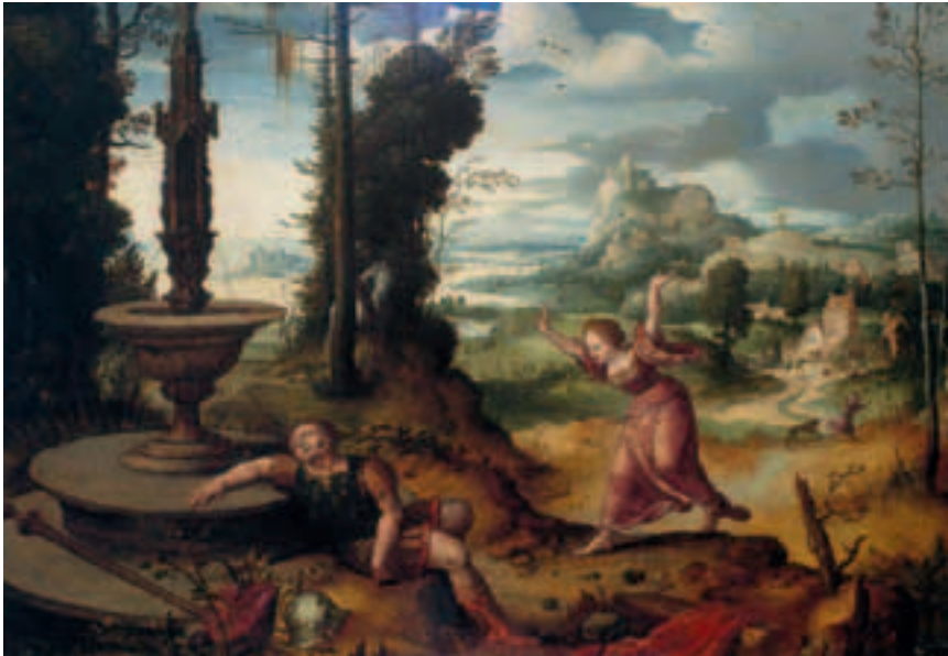
Landschap met Pyramus en Thisbe, paneel, 48x70cm, ca 1540-1550, Gemeentemuseum Helmond