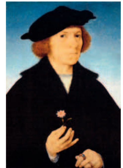
Zelfportret van Joos van Cleve, ca 1519, paneel, 38 x 27 cm. Museo Thyssen-Bornemisza, Madrid

Heel opmerkelijk is het onderwerp David en Bathseba , dat hij kennelijk in negen versies geschilderd heeft. Het toont rechts het paleis van David en links de tuin van Bathseba en daartussen een gebied met een speelveld voor een balspel, het uit Frankrijk afkomstige Jeu de Paume, de voorloper van tennis. Daarnaast een grasveld (voor schietoefeningen) en op de achtergrond een kruisvormige doolhof. Enkele versies