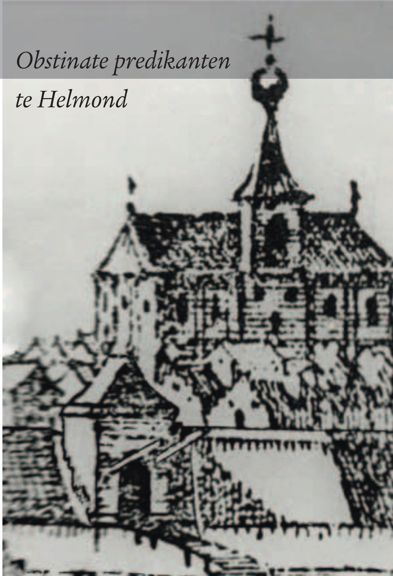
Afbeelding van de middeleeuwse Lambertuskerk in de Kerkstraat. Op de voorgrond zijn de Veepoort en de aarden stadswal te zien.