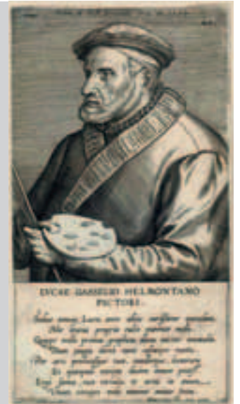
Portret van Lucas Gassel vervaardigd door Hieronymus Wierix

Ghy Lucas weest gegroet voor allen and'ren weert, Die van my sijt niet min als eyghen Vader gh'eert, Die my ghegeven zijt ten eersten een beginder, Van dat ick worden ben een Schilder-const beminder, Als ghy Landschap en hut maelt met gheleerde handt, U vroomheynt was ghelijck u Const en u verstandt, En al dat 't vromer hert door liefde can gheleyden: Daerom laet van u deucht, en Const 't gherucht uytbreyden, En stadich leven oock van nu tot alder tijdt, O oudt man, die my lief om twee oorsaken zijt.