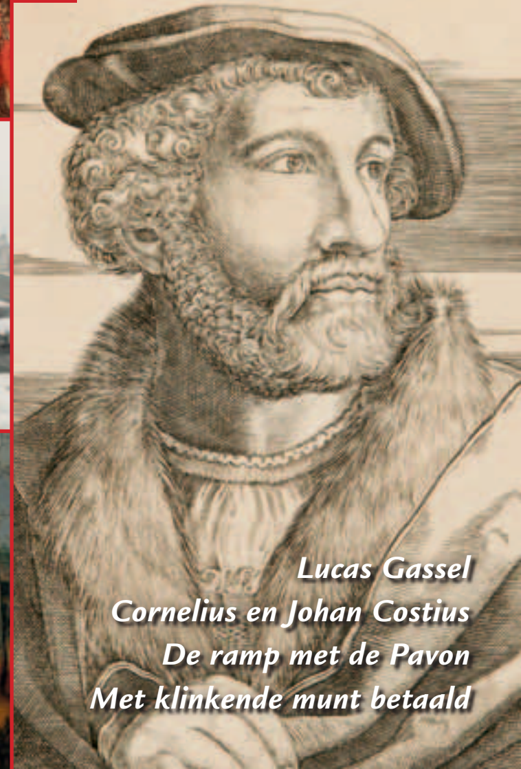
Lucas Gassel Cornelius en Johan Costius De ramp met de Pavon Met klinkende munt betaald