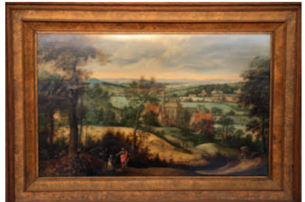
Landschap met Christus en de vrouw uit Kanaän, ca 1550, National Gallery Praag

Over mogelijke leermeesters van Lucas en over contacten met andere kunstenaars en opdrachtgevers is ook weinig bekend. Er is wel aangenomen, maar dat is ook weer niet zeker, dat hij