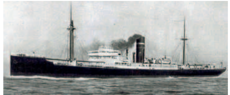
Vrachtboot Pavon open zee.